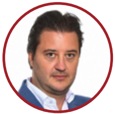
Daniel Rota AD, Webidoo