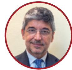
Fabrizio Lobasso Vice Direttore Generale per la promozione del Sistema Paese, Ministero degli Affari Esteri e della Cooperazione Internazionale